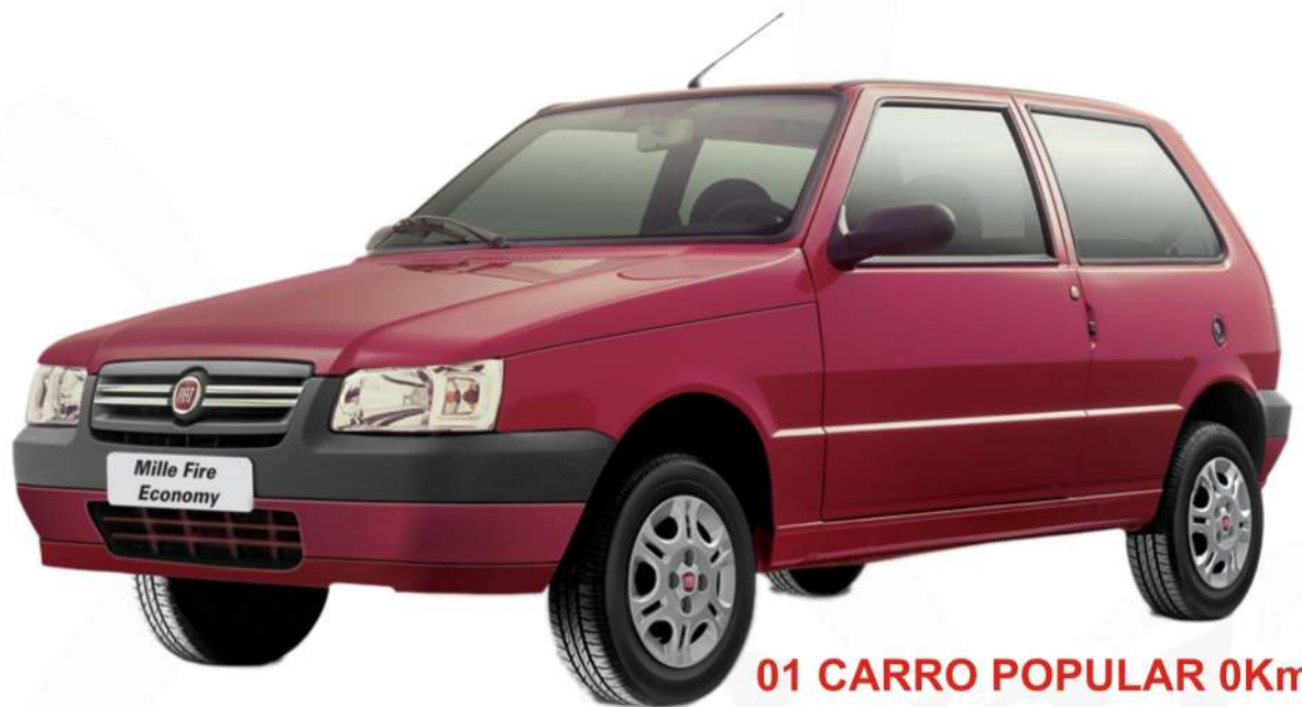
01 CARRO POPULAR 0Km

Conheça alguns da Promoção de Natal do Beira Praia Shopping.