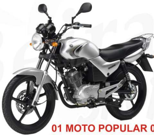
01 MOTO POPULAR 0Km